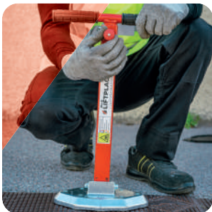
ÉTAPE 1 Ajuster le manche à l'aide du bouton de réglage