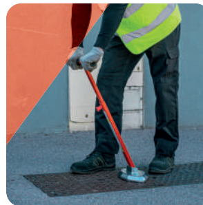
ÉTAPE 3 Pour le décrochage de l'aimant, abaisser le manche contre la butée