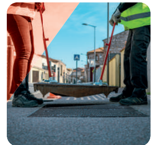
ÉTAPE 4 Possibilité de manipuler avec 2 MINI-LIFTPLAQ®+