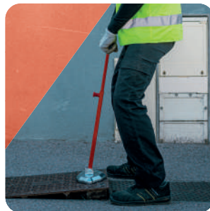
ÉTAPE 2 Aimanter au bord, lever légèrement et tirer en faisant glisser la plaque au sol