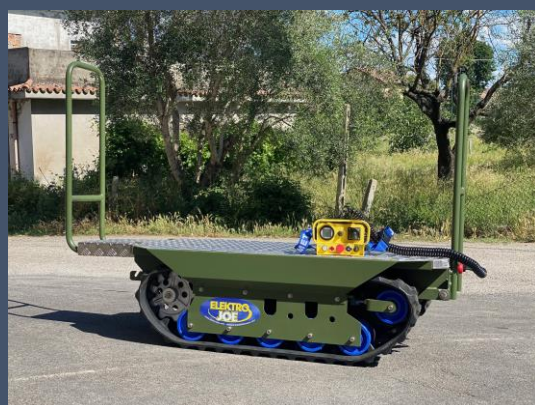
Barre de soutien avant ou arrière