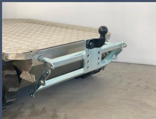
Kit boule d'attelage