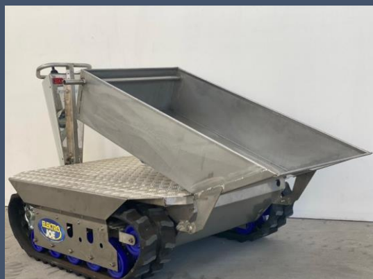
Benne basculante manuelle