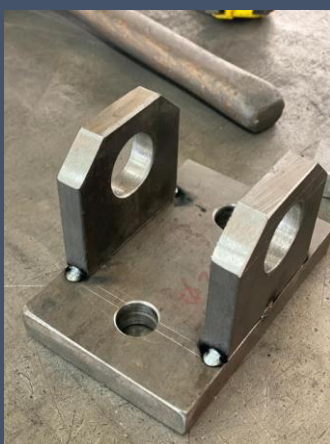
Kit attelage type agri