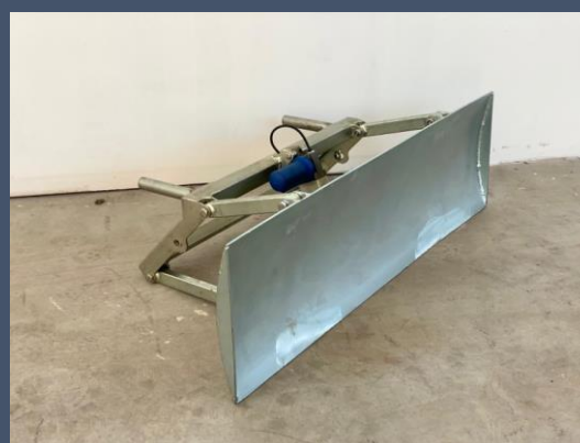
Kit lame électrique